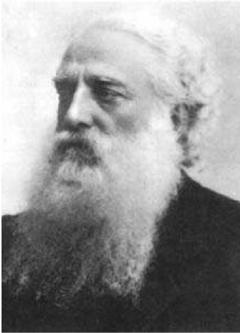
올코트 (Olcott) 대령